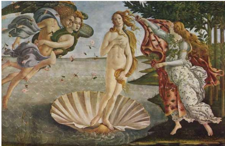
Figura 8: Quadro “O Nascimento de Vênus”, de Sandro Botticelli representa a deusa do amor, cujo nome grego é Afrodite. (Sandro Botticelli; Domínio Público)