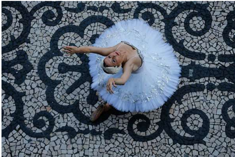
Figura 11: Cecília Kerche é uma famosa bailarina brasileira, que assumiu em 1986 a posição de primeira bailarina do Teatro Municipal do Rio de Janeiro.