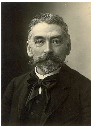
Figura 5: Stéphane Mallarmé (1842–1898) (Paul Nadar; Domínio Público)