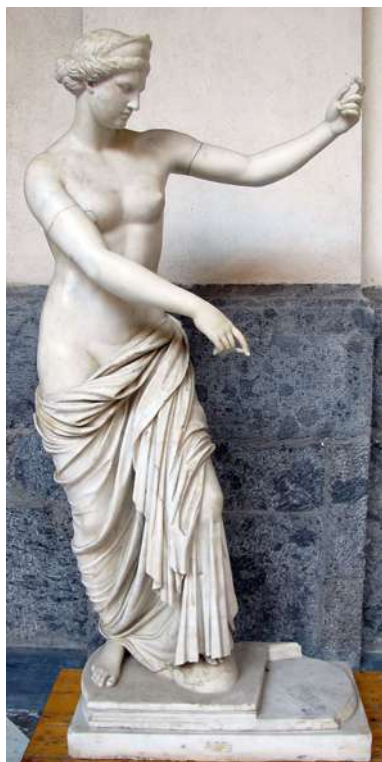
Figura 9: Estátua de Afrodite exposta no Museu Arqueológico de Nápoles. É uma cópia da estátua grega de 310-200 A.C. (Museu Arqueológico de Nápoles; CC-BY 3.1)

Justificativa É verdade que desde sempre o ser humano teve suas crenças e mitologias próprias. Os indígenas das Américas, os africanos das diversas partes do continente, os povos judeus e os nórdicos... Cada um deles tem uma mitologia diferente, composta por divindades com poderes e áreas de atuação específica na vida dos seres humanos que lhes cultuam. Eis algo que unem todas estas manifestações: as divindades não existem por si só, mas sim em relação àqueles que nelas creem e lhes pedem por ajuda nas dificuldades quotidianas da vida humana.