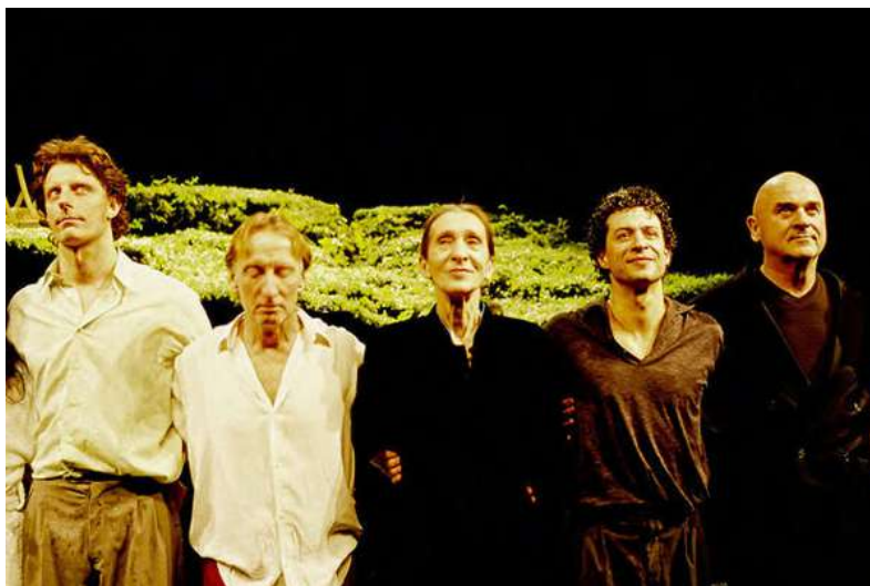
Figura 7: Pina Bausch foi uma importante dançarina e coreógrafa alemã.

da ação, a partir de uma reflexão do sujeito sobre si mesmo enquanto sujeito agente, a partir de uma teoria das condições de possibilidade da ação, mas a partir de uma lógica da paixão, uma reflexão do sujeito sobre si mesmo enquanto sujeito passional.