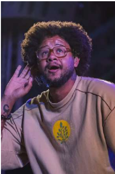
Figura 3: Emicida (1985-)