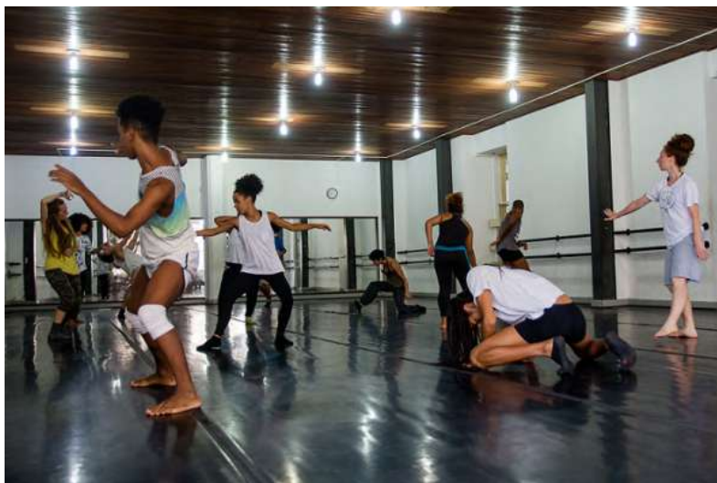
Figura 6: Oficina de dança contemporânea

Objetivo Proporcionar aos e às estudantes um ambiente propício à criação literária – mais especificamente, poética. Espera-se que eles e elas, seguindo os exemplos apresentados nas últimas aulas, sintam-se à vontade para criar suas próprias obras.