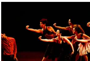
Figura 12: Espetáculo da Companhia de Dança Deborah Colker

E, de encontro com a fala de Sidney Rocha, ver a cidade por meio da dança e entender prédio e narrativa como construção, também foram temáticas recorrentes na obra de outra coreógrafa, a americana Trisha Brown (1936–2017), em sua série: “Rooftop Piece” de 1971 (disponível aqui 7 ).