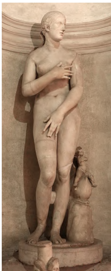
Figura 10: Estátua de Afrodite exposta na “Biblioteca Nazionale Marciana”, em Veneza