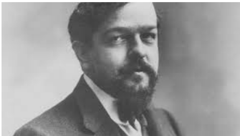
Figura 4: Claude Debussy (1862–1918) (J. Cuthbert Hadden; Domínio Público)

Justificativa Sabemos que desde a antiguidade ocidental existe uma relação criativa entre as linguagens artísticas, como verificamos no recurso da écfrase – grosso modo, quando um poema é escrito a partir de uma imagem, quadro, escultura ou paisagem.