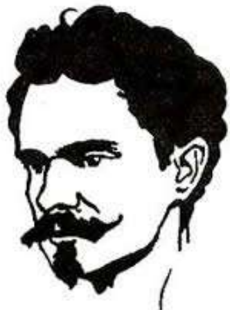
Figura 2: Alphonsus de Guimarães (1870–1921) (Desenho de Calixto; )